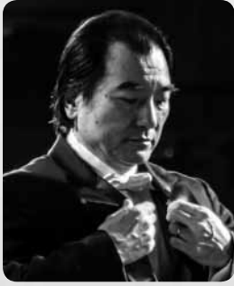
井崎正浩 指揮 Izaki Masahiro

現在ハンガリーを拠点にヨーロッパ、日本各地で活躍を続ける指揮者。2007年よりハンガリー・ソルノク市の音楽総監督を務め、同市の音楽・文化団体を総括する重責を担い、Newsweek紙や「音楽の友」誌において海外で活躍する日本人として掲載される榮譽を得た。最近ではロシア・ナショナル管、ベルリン響、デュッセルドルフ響等への客演も行い国際的な展開を行っている。