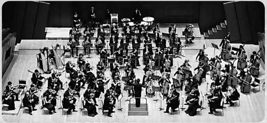
ワグネル・ソサイエティー・OBオーケストラ

福岡県出身。福岡教育大学音楽科卒業、オーストリア国立ウィーン音楽大学に学ぶ。指揮法を故安永武一郎、故遠藤雅古、伊藤栄一、湯浅勇治、故エステルライヒャー、トリングの各氏に師事。