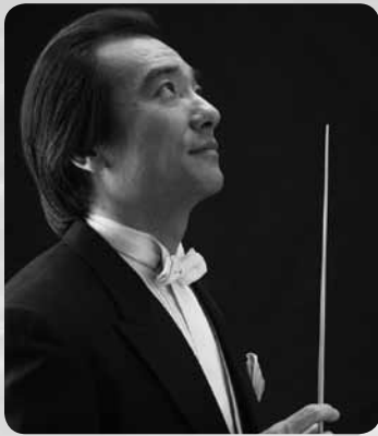
井崎正浩 指揮 Izaki Masahiro